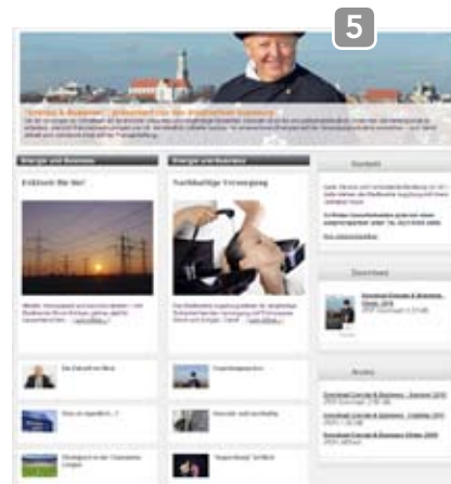
BEISPIEL „B4B PARTNER MICROSITE“